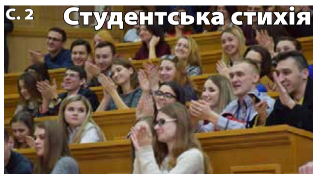
С. 2 Студентська стихія

адже світ змінюється, і набуті колись навички сьогодні можуть бути радикально модифікованими. В сучасних умовах для українських університетів це вкрай актуальна, хоч і в певній мірі нова справа. Наш Університет раніше вже проводив навчання для співробітників лабораторій факультетів, та нині до навчання залучено майже 1000 співробітників КНУ – у такому глобальному масштабі це перший університетський досвід. З метою підвищити якість комунікацій у межах самого Університету адміністрація поширила вдалу практику на навчально-допоміжний персонал, інженерно-технічний персонал НДЧ та службу експлуатації. Для кожної групи працівників підготовлена окрема програма навчання з різним наповненням, згідно зі специфікою їхньої роботи. Подібну схему роботи щодо підвищення кваліфікації плануємо проводити на постійній основі.