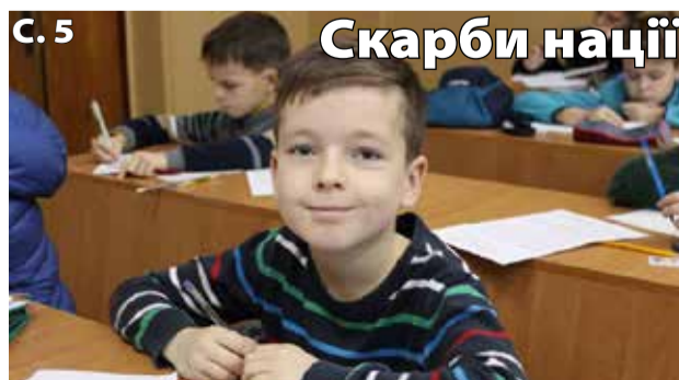
С. 5 Скарби нації