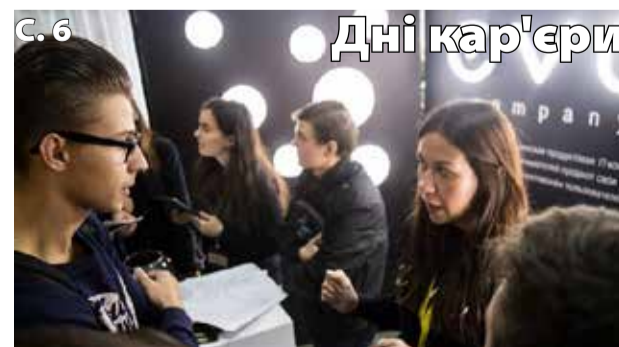
С. 6 Дні кар'єри